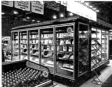
(左上から時計回りに) ホシザキが展示したR600a業冷库、ガリレイが近日発売するR290プラグイン冷凍ショーケース、システムが展示したウォーターループ対応のR290ショーケース、レイテックが展示したウォーターループ対応のR290ショーケース

ン冷凍ショーケースも展示した。サンデン・リテックは、昨年発売した6馬力のCO 2 冷凍機や、R600aの卓上ショーケース等を展示した。